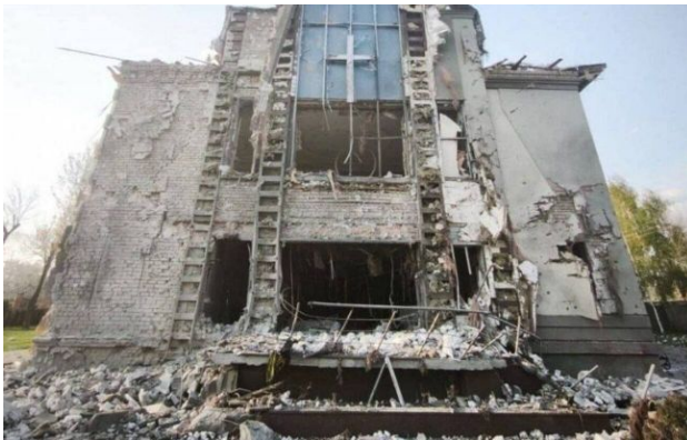
Фото: наслідки російської атаки на Запоріжжя 16 квітня (Запорізька ОВА)

Російські окупанти ввечері 16 квітня завдали удару керованою авіабомбою по Запоріжжю. Внаслідок атаки зруйновано молитовний дім, є загиблий та поранені.