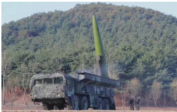
Фото: ракета KN-23

Північнокорейські балістичні ракети, якими Росія атакує Україну, не є прямими копіями російських "Іскандерів". Дослідження уламків виявило використання цивільних чипів та застарілих технологій 50-річної давнини.