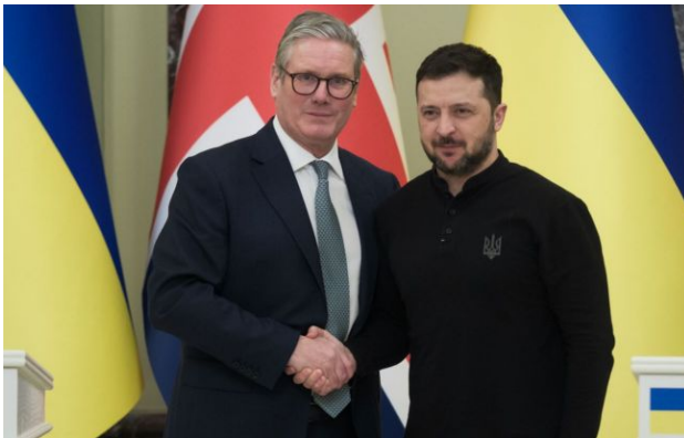
Фото: прем'єр Кір Стармер та президент Володимир Зеленський

Обирайте перевірене - додайте РБК-Україна до улюблених джерел у Google