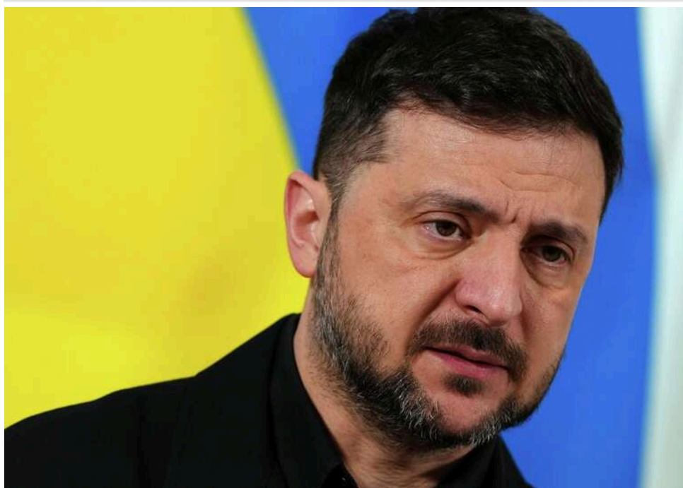
Зеленський: Вступ України до ЄС важливіший і реалістичніший за членство в НАТО

Зеленський зазначив, що для України вступ до ЄС кращий, ніж до НАТО.