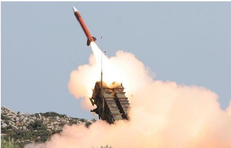
Запуск ракети ЗРК Patriot

На тлі війни на Близькому Сході Україна вже не перебуває в центрі міжнародної уваги, визнав президент.