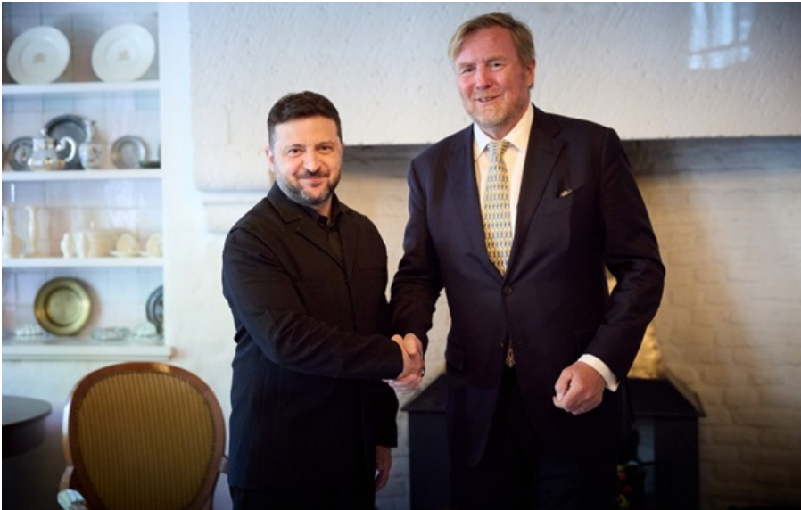
Зеленський провів зустріч із королем Нідерландів Віллемом-Александром

Зеленський подякував королю за особисту підтримку України та всього Українського народу впродовж понад чотирьох років боротьби проти повномасштабної російської агресії.