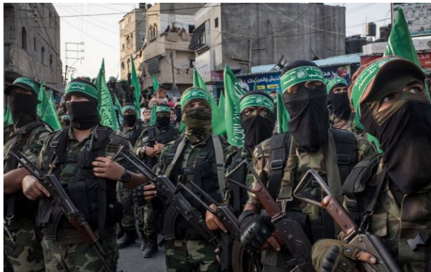
Фото: бойовики ХАМАС (Getty Images)

Обирайте перевірене - додайте РБК-Україна до улюблених джерел у Google