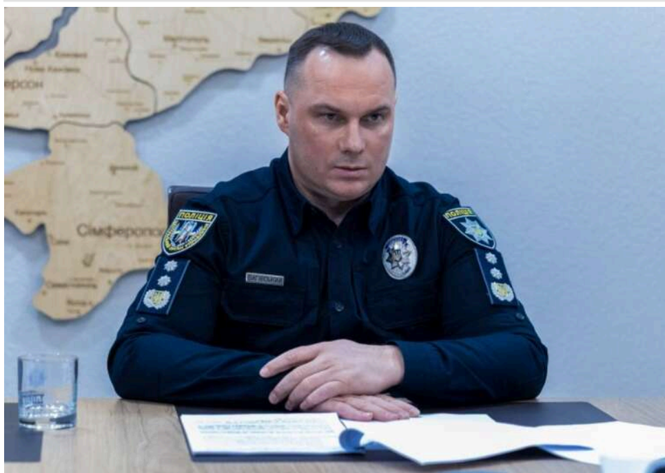
Від побутової сварки до теракту: голова Нацполіції Вигівський розкрив деталі стрілянини в Києві

Вчорашній напад у Києві, розцінений як теракт, стався через звичайну побутову сварку.