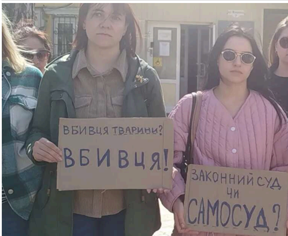
Маніпуляції з витягами та неявка слідчого: як в Ірпені через суд домагалися розслідування жорстокості охоронця

У середу, 15 квітня 2026 року, в Ірпінському міському суді розглянули скаргу щодо невнесення відомостей до ЄРДР у справі про вбивство собаки Тігри в Гостомелі. Йдеться про інцидент у магазині "Фора", де охоронець звинувачується у жорстокому вбивстві тварини. На засідання прийшли небайдужі з плакатами на підтримку. У підсумку суд зобов'язав поліцію відкрити кримінальне провадження протягом 24 годин.