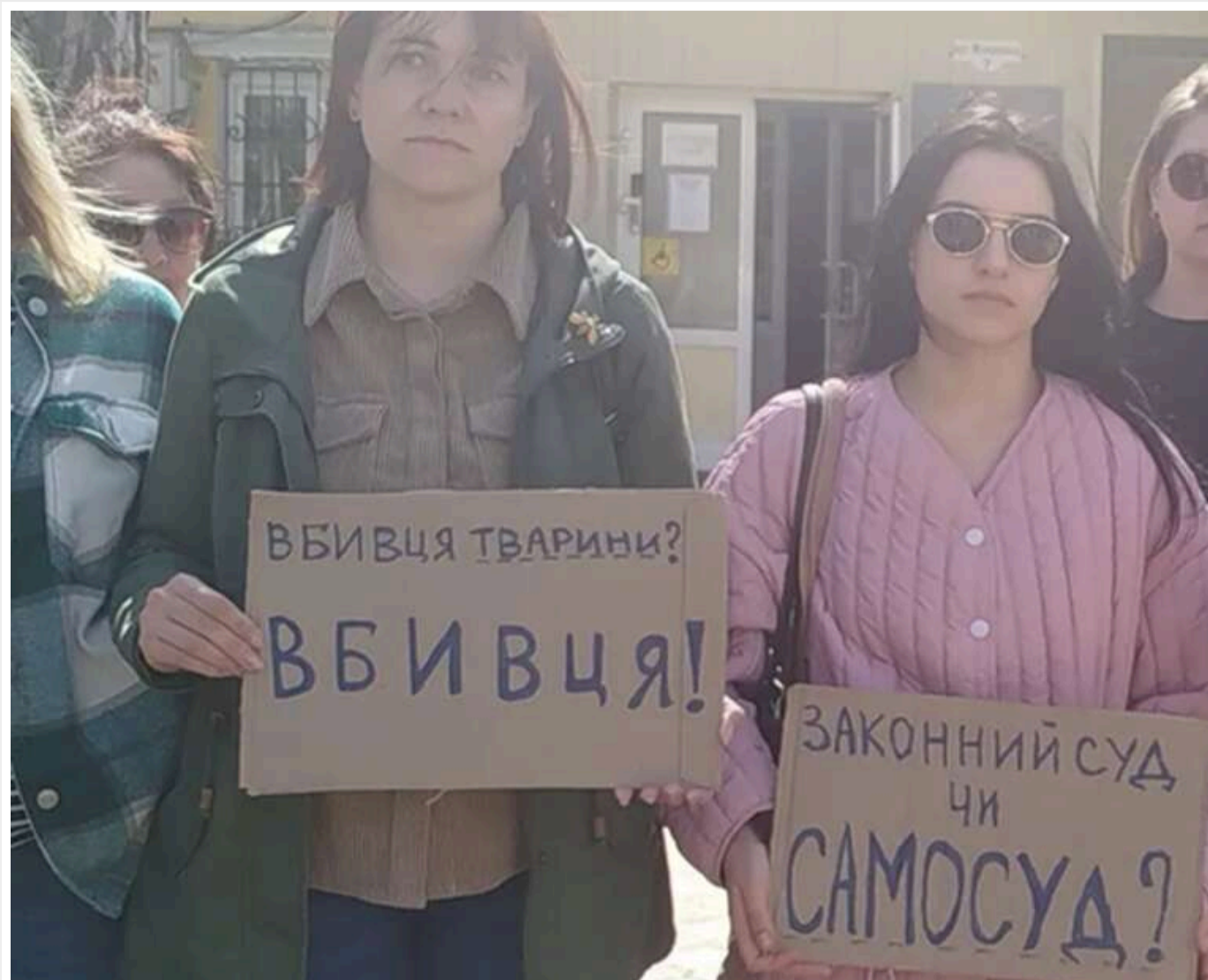
Маніпуляції з витягами та неявка слідчого: як в Ірпені через суд домогалися розслідування жорстокості охоронця

У середу, 15 квітня 2026 року, в Ірпінському міському суді розглянули скаргу щодо невнесення відомостей до ЄРДР у справі про вбивство собаки Тігри в Гостомелі. Йдеться про інцидент у магазині "Фора", де охоронець звинувачується у жорстокому вбивстві тварини. На засідання прийшли небайдужі з плакатами на підтримку. У підсумку суд зобов'язав поліцію відкрити кримінальне провадження протягом 24 годин.