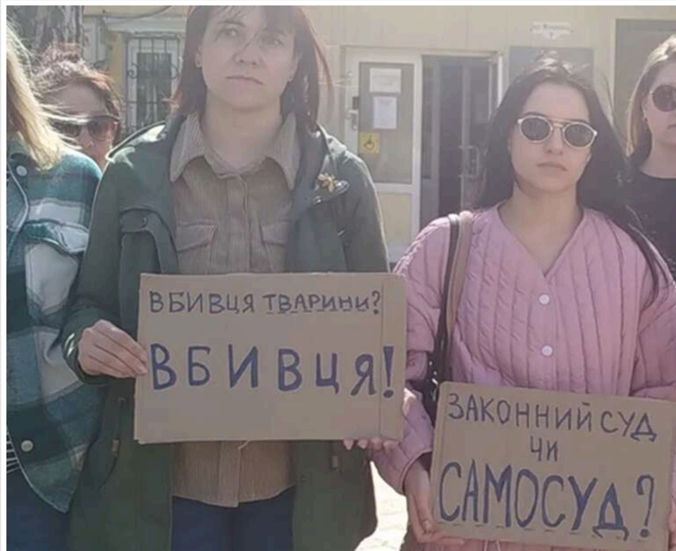
Маніпуляції з витягами та неявка слідчого: як в Ірпені через суд домагалися розслідування жорстокості охоронця

У середу, 15 квітня 2026 року, в Ірпінському міському суді розглянули скаргу щодо невнесення відомостей до ЄРДР у справі про вбивство собаки Тігри в Гостомелі. Йдеться про інцидент у магазині "Фора", де охоронець звинувачується у жорстокому вбивстві тварини. На засідання прийшли небайдужі з плакатами на підтримку. У підсумку суд зобов'язав поліцію відкрити кримінальне провадження протягом 24 годин.