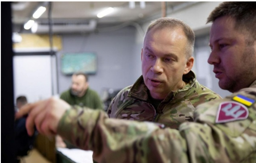
Олександр Сирський і Олег Апостол провели нараду

В ході наступальної операції ЗСУ відновили контроль над 480 кв. км території у двох областях.