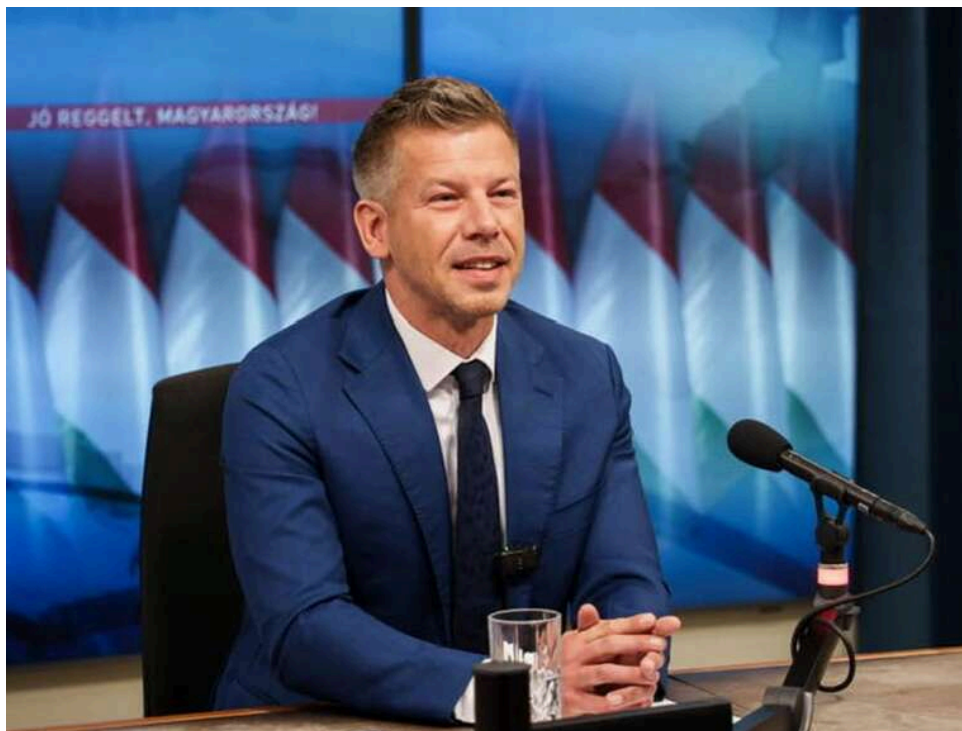
Петер Мадяр анонсував перенесення офісу прем'єра з Кармелітського палацу в Угорщині

Лідер партії-переможці парламентських виборів в Угорщині та очікуваний майбутній прем'єр Петер Мадяр анонсував перенесення урядового офісу з Кармелітського палацу, де працював уряд Віктора Орбана.