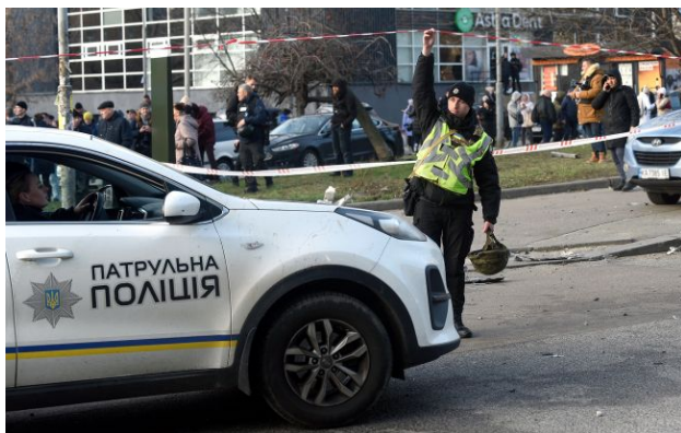
Фото: у Чернігові стався інцидент зі зброєю

У Чернігові поблизу готельного комплексу "Градецький" стався інцидент зі зброєю. Поліція вилучила у чоловіка стартовий пістолет, постраждалих немає.