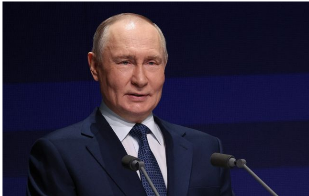
Фото: російський диктатор Володимир Путін

Обирайте перевірене - додайте РБК-Україна до улюблених джерел у Google