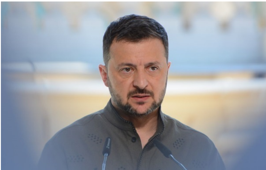
Володимир Зеленський привітав всіх, хто в Україні та світі відзначає Великдень сьогодні

Президент побажав всім Божої благодаті і мирного життя на нашій землі та під українським небом, які захищають ЗСУ.