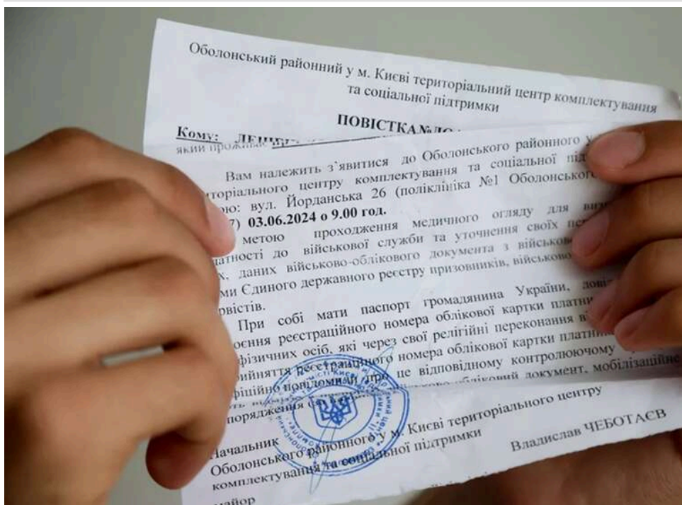
Фейковий візит до ТЦК: одеський митник не зміг через суд виправдати прогул "недійсною" повісткою

Повістка без номера не врятувала від догани: одеський митник програв суд через прогул «під прикриттям» ТЦК.