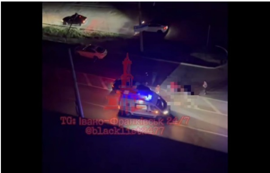
Фото: Скріншот Швидка допомога на місці ДТП в Івано-Франківську

У поліції пообіцяли максимально сприяти проведенню повного, всебічного та об'єктивного розслідування.