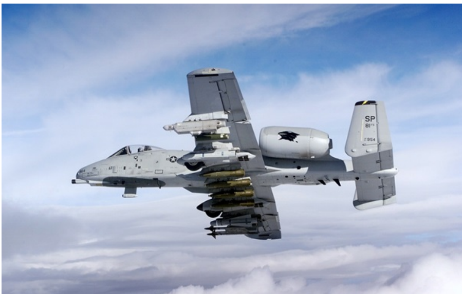
A-10 Warthog (иллюстративное фото)

Иранские военные в течение дня сбили сразу два американских самолёта и один вертолёт. Это первые потери ВВС США в этой войне.