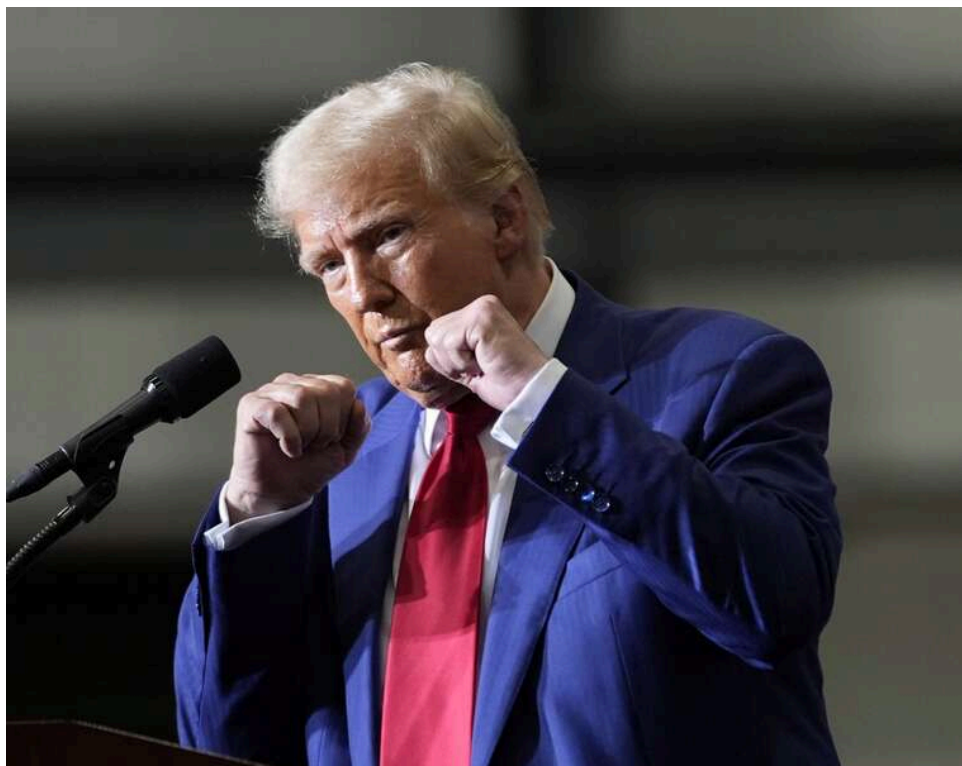
Дві "червоні лінії" Трампа: WSJ дізналася головні умови США для завершення війни з Іраном

Президент США Дональд Трамп має принаймні дві ключові «червоні лінії» у переговорах з Іраном щодо припинення війни.