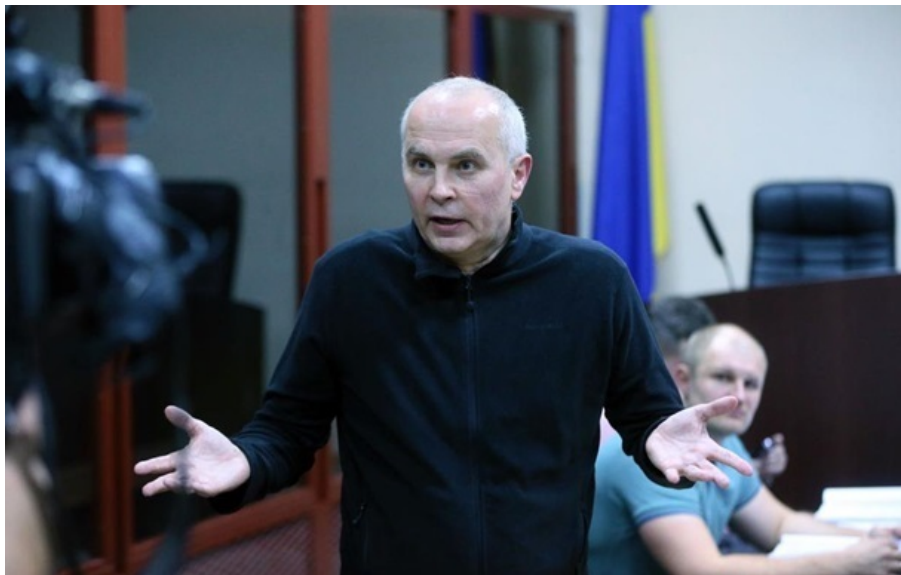
Нестор Шуфрич був затриманий 15 вересня 2023 року

Тепер Нестор Шуфрич перебуватиме під цілодобовим домашнім арештом із носінням електронного засобу контролю.