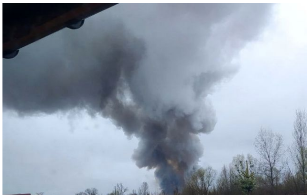
Ілюстративне фото: вибух

Служба безпеки України повідомила про результати операції, під час якої спільно з Силами безпілотних систем ЗСУ було знищено ворожі ешелони з паливом поблизу Луганська.