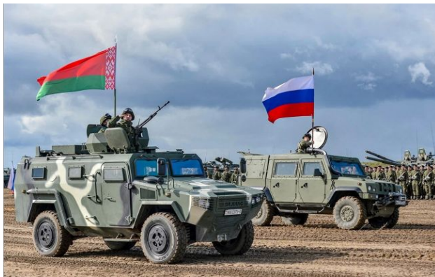
Фото: Коваленко оцінив ризики ескалації на кордоні з Білоруссю

Росія готує Білорусь до можливої ескалації, проте наразі загрози повторного вторгнення з півночі немає. Сили оборони повністю контролюють ситуацію на кордоні.