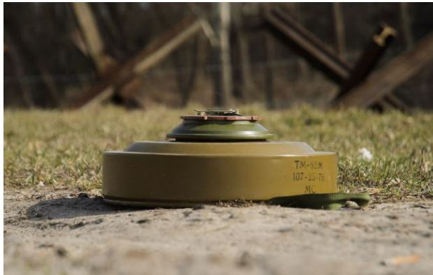
Фото: небезпечні знахідки дають знати про себе й досі (РБК-Україна)

Обирайте перевірене - додайте РБК-Україна до улюблених джерел у Google