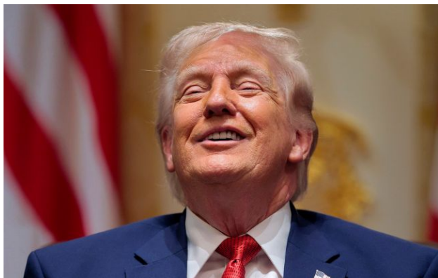
Фото: президент США Дональд Трамп

Обирайте перевірене - додайте РБК-Україна до улюблених джерел у Google