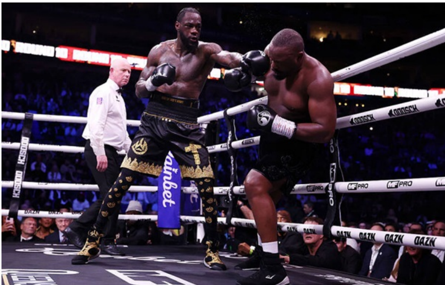
Деонтей Вайлдер - Дерек Чісора

Головна подія вечора боксу в Лондоні ледь не обернулася грандіозним скандалом на самому початку.