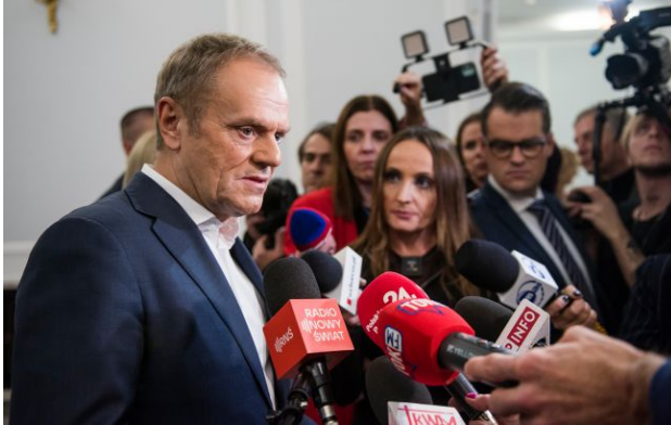
Фото: прем'єр-міністр Польщі Дональд Туск (Getty Images)

Обирайте перевірене - додайте РБК-Україна до улюблених джерел у Google