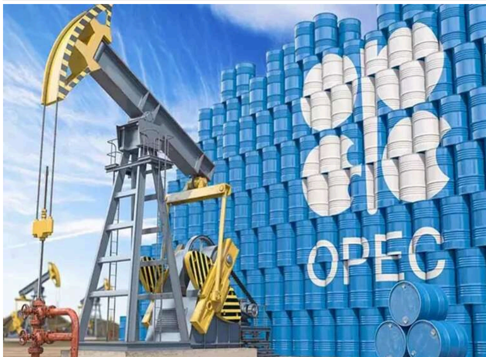
ОАЕ оголосили про вихід з ОПЕК та формату ОПЕК+, – Reuters

Об'єднані Арабські Емірати (ОАЕ) оголосили про вихід з Організації країн – експортерів нафти (ОПЕК) та її розширеного формату (ОПЕК+). Країна була членом картелю з 1967 року.