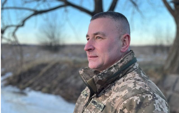
Фото: генерал-майор Віктор Ніколюк (facebook.com/kommander.nord)

Оперативне командування "Схід" отримало нового керівника. Ним став генерал-майор Віктор Ніколюк, який раніше керував обороною Чернігівщини.