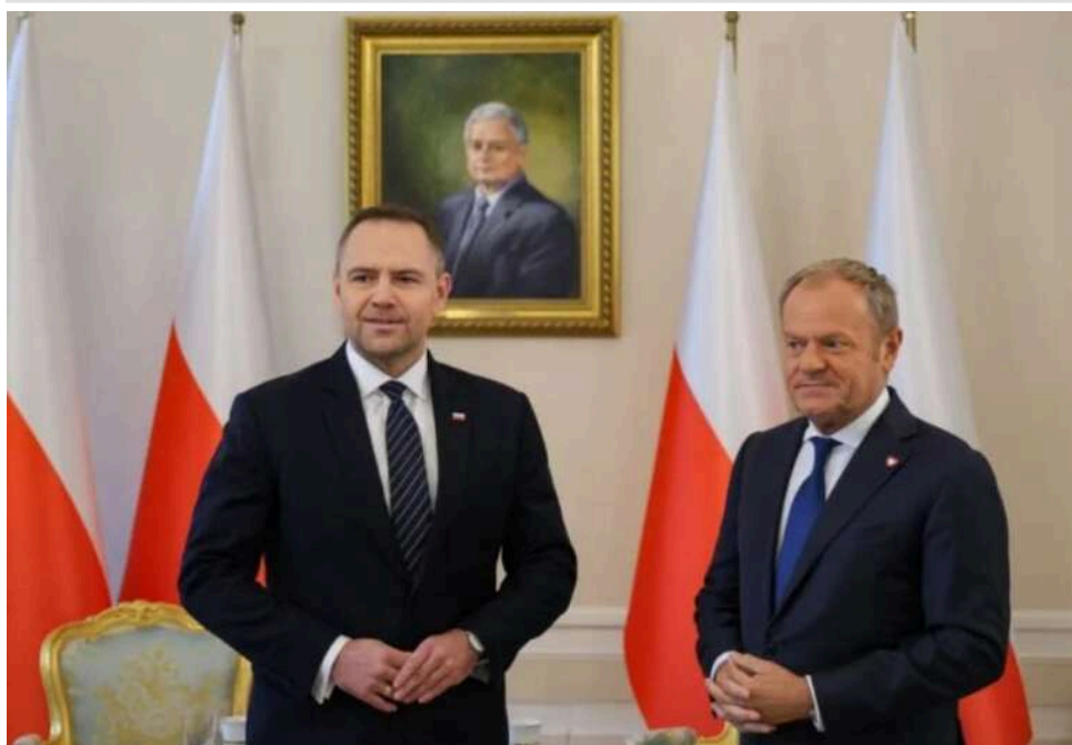
Politico: У Польщі загострився конфлікт між президентом і урядом через конституційну реформу

У Польщі розгорається гострий політичний конфлікт між президентом Каролем Навроцьким і урядом Дональда Туска. Причиною ескалації стало рішення глави держави розпочати процес перегляду основного закону країни.