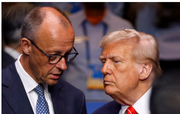
Фото: канцлер ФРН Фрідріх Мерц та президент США Дональд Трамп (Getty Images)

Обирайте перевірене - додайте РБК-Україна до улюблених джерел у Google