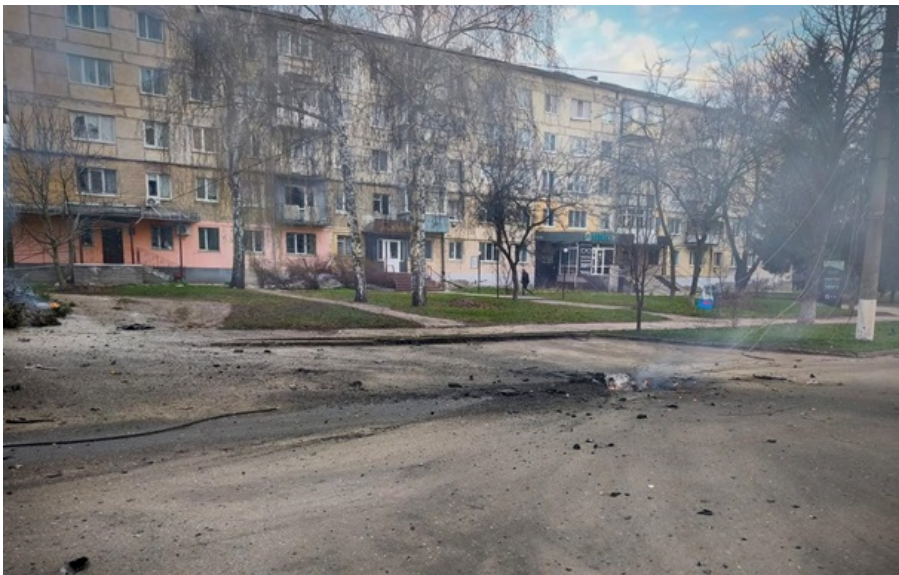
Наслідки російських обстрілів на Сумщині