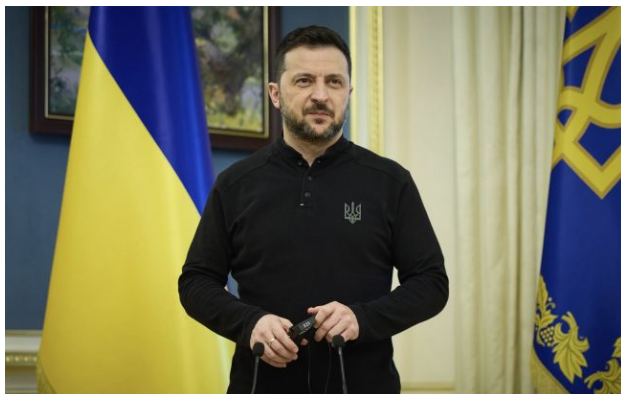
Фото: Володимир Зеленський (president.gov.ua)

Обирайте перевірене - додайте РБК-Україна до улюблених джерел у Google