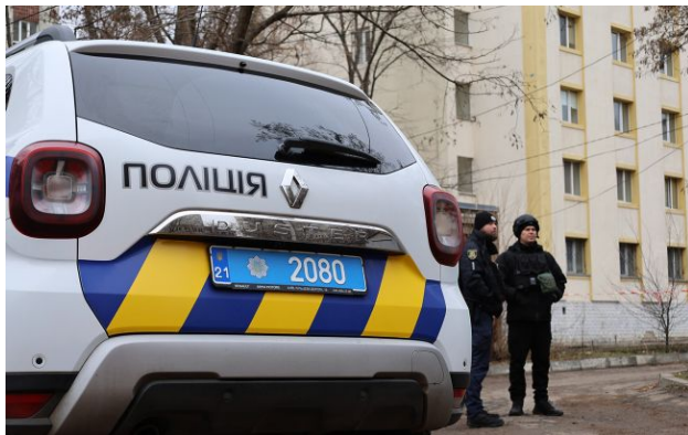
Фото: поліція Київщини розслідує обставини смертельної аварії

Обирайте перевірене - додайте РБК-Україна до улюблених джерел у Google