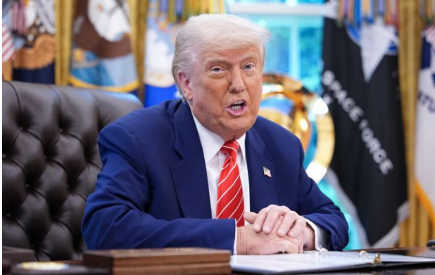
Фото: Дональд Трамп

Обирайте перевірене - додайте РБК-Україна до улюблених джерел у Google