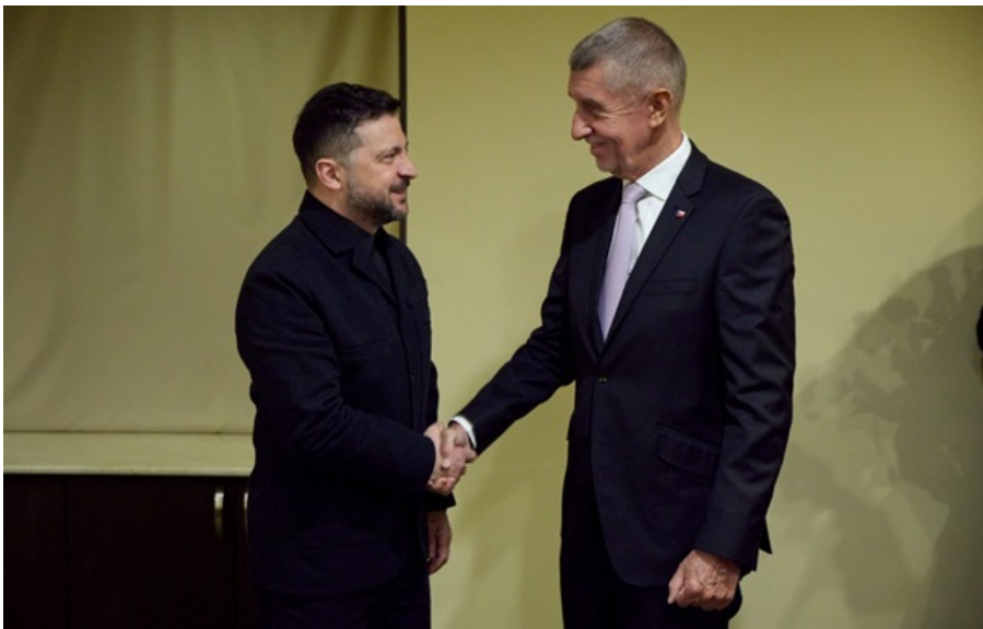
Фото: Офіс президента Володимир Зеленський зустрівся з Андреем Бабішем у Вірменії

Сторони детально обговорили двосторонні напрями відносин між Україною та Чехією та посилення співпраці.