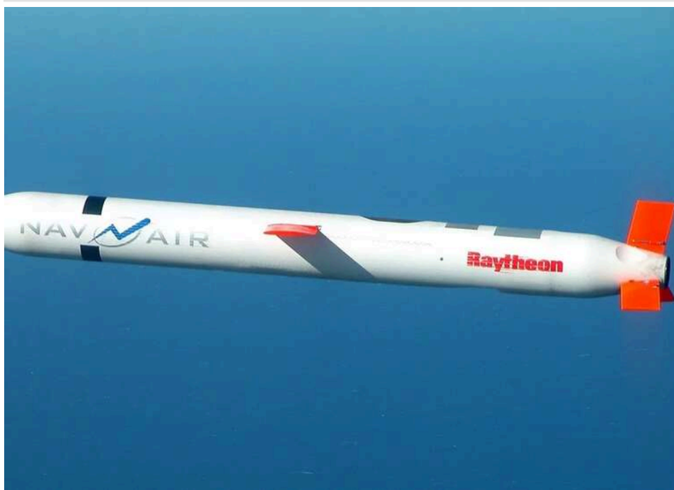
США відмовилися від розміщення ракет Tomahawk у Німеччині, – Reuters

США переглянули військові плани щодо Німеччини та відмовилися від розміщення крилатих ракет Tomahawk на її території.