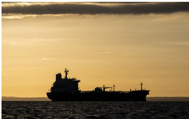
Фото: танкери РФ використовують фальшиве страхування для обходу санкцій

Ряд російських танкерів "тіньового флоту" перевозять нафту, використовуючи страхові сертифікати від неіснуючої німецької компанії для обходу міжнародних санкцій.