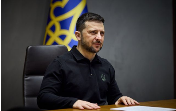
Фото: президент України Володимир Зеленський

Обирайте перевірене - додайте РБК-Україна до улюблених джерел у Google