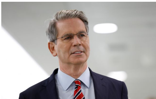
Фото: Скотт Бессент (Getty Images)

Обирайте перевірене - додайте РБК-Україна до улюблених джерел у Google