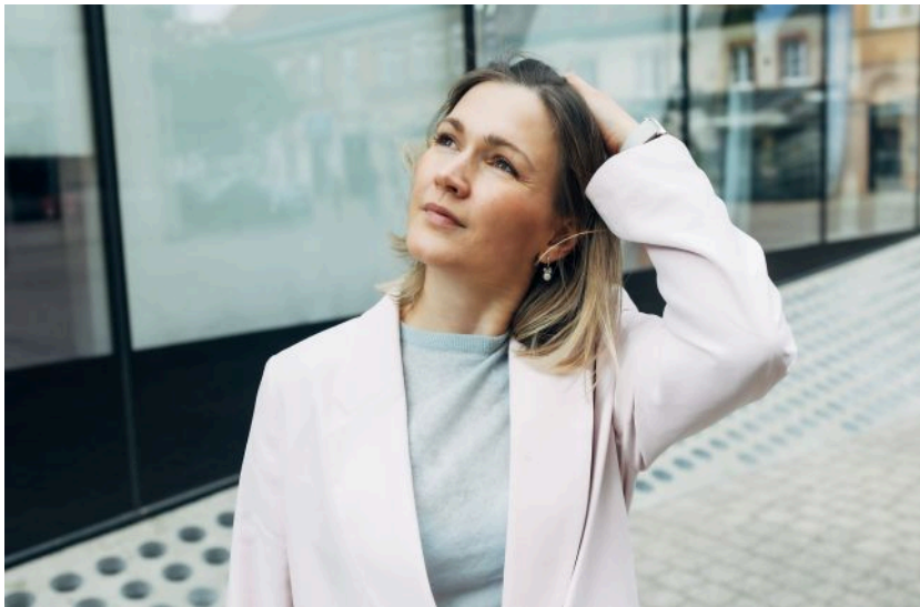
Інколи небо підносить унікальні явища, тож дивитись вгору - буде не зайвим