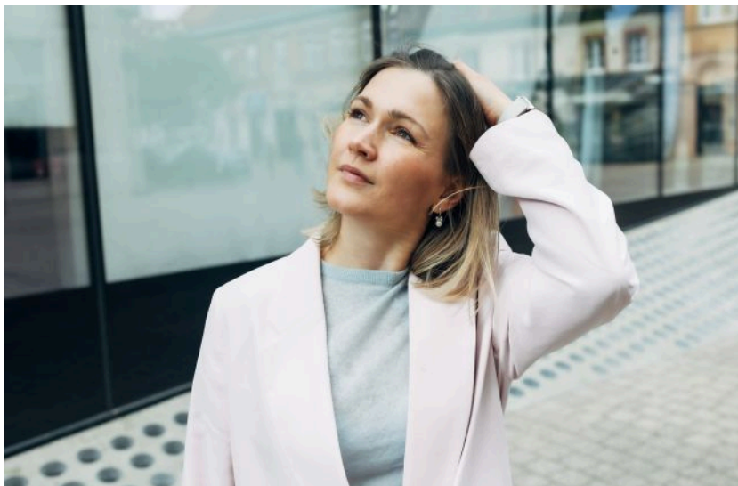
Інколи небо підносить унікальні явища, тож дивитись вгору - буде не зайвим