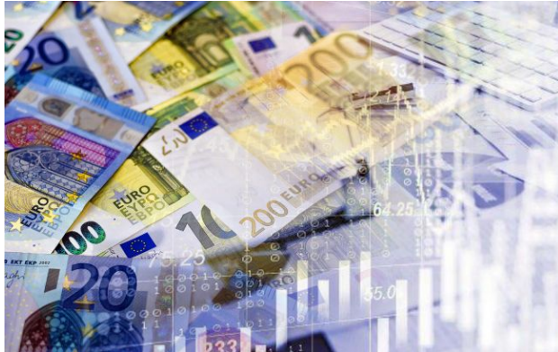
Фото: яким буде курс євро завтра

Нацбанк знову підвищив курс долара на п'ятницю, 17 квітня. А європейська валюта вдруге за тиждень встановлює рекорд.