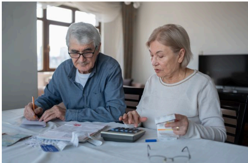
Середня пенсія працюючого українця становить 7904,38 грн