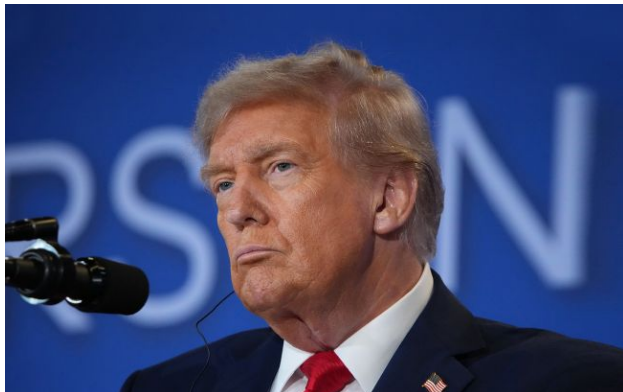
Фото: президент США Дональд Трамп (Getty Images)

США висунули ультиматум Ірану з вимогою прийняти нову угоду, пообіцявши знищити критичну інфраструктуру країни у разі відмови. Тегерану дали час до завершення переговорів у Пакистані.