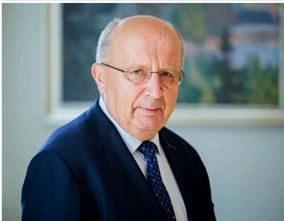
Єврокомісар Кубілюс запропонував створення нового Європейського оборонного союзу

Єврокомісар з питань оборони Андрюс Кубілюс запропонував міжурядовий європейський договір для створення нового оборонного союзу. Він покликаний підготувати блок до самостійного захисту і має включати Україну, Норвегію та Велику Британію.