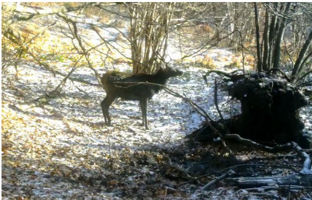
Фото: олень в Карпатах влаштував "грязьові ванни"

У Карпатах зафіксували рідкісні кадри з життя дикої природи - фотопастки зняли, як олень благородний влаштував "водні процедури" просто посеред лісу.