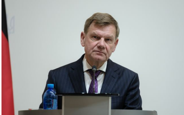
Фото: Йоганн Вадефуль (Віталій Носач, РБК-Україна)

Обирайте перевірене - додайте РБК-Україна до улюблених джерел у Google