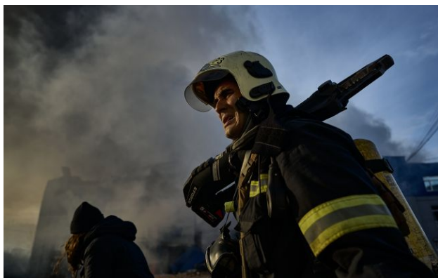
Фото: Запоріжжя зазнало ворожого удару, на місці працюють екстрені служби (Getty Images)

Обирайте перевірене - додайте РБК-Україна до улюблених джерел у Google