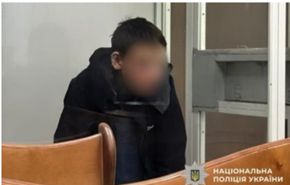
Причетних арештували

Один із затриманих - 23-річний місцевий – забезпечив спостереження за місцем злочину. Тоді як 17-річний житель Вінниччини виготовив і заклав вибухівку.